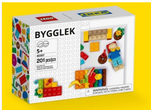
Kamil Strzelec kl.VI

Lego nawiązała współpracę z sklepem budowlanym Ikea