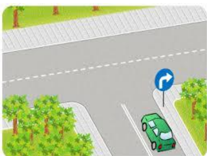
Skręt w prawo

Manewr ten należy zasygnalizować kierunkowskazem lub ręką wyciągniętą w kierunku w którym skręcamy